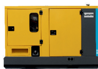
QES 60 ATLAS COPCO