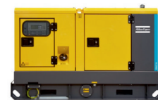
QAS 20 STUFE V ATLAS COPCO