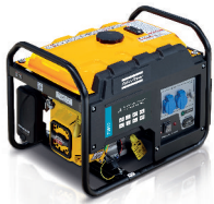
P3000 ATLAS COPCO