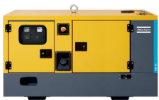
QES 30-40 ATLAS COPCO