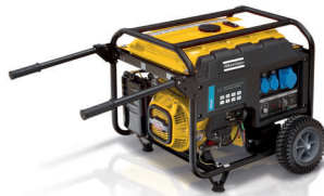
P6500T ATLAS COPCO