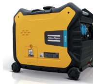
P3500i ATLAS COPCO