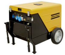
QEP S7 ATLAS COPCO